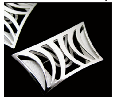
Neodesignin Sibeliustalolle toteuttama vip-lahjakokonaisuus, Sointu solmio- ja rintaneula. Suunnittelu Antti Merenlahti.

mallistoista mielenkiintoisia ja jopa jännittäviä.